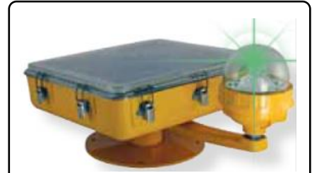
AV-HL-RF-SOL 太陽能直昇機停機坪指示燈，無線控制 LED 直升機指示燈