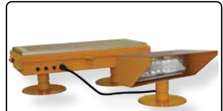
AV-FL-RF-SOL 太陽能 LED 投光燈 能夠清楚標示飛機起飛及降落位置