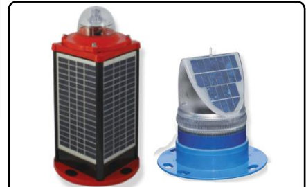
AV-C410 or AV-70-HI 太陽能 LED 跑道燈 作為機場跑道到終點指示燈 或者跑道邊標示燈用