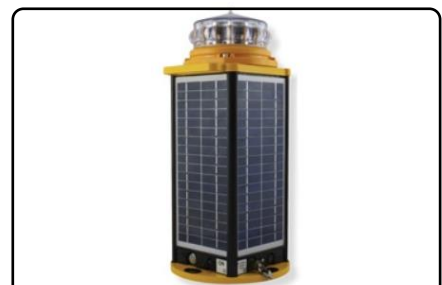
AV-425 太陽能 LED 跑道燈，可無線控制，設定常亮或閃爍，作為飛機接近指示燈用