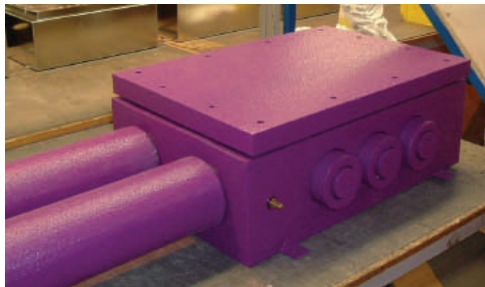
STBZTMP6040 K-Mass Coating 實例