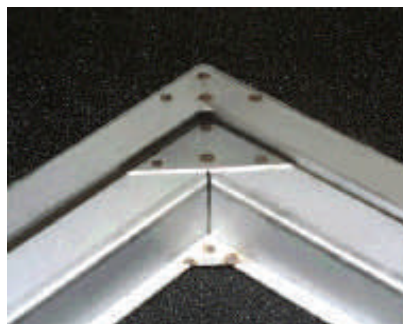
框架 眾多不同大小的框架，可組裝不同大小的防火箱