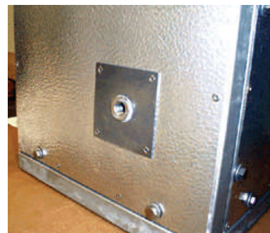
帶有洞孔的防火面板 方便內部組件與外部管道配件相連結